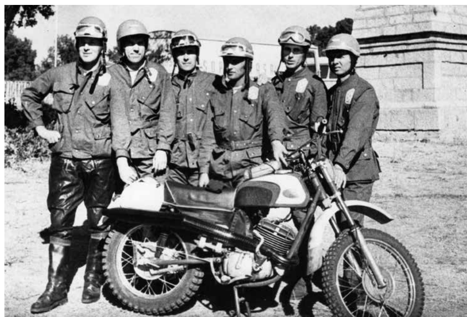
45. ročník šestidenní, Španělsko 1970.

Je to těžké. Myslím, že se mladí jezdcí po revoluci nemohou věnovat sportu tak, jak by chtěli. Po roce 1989 byly všechny kluby, Svazarmy a Dukly se zaměřením na motocyklový sport zrušeny, a pokud jezdcé neplatí movití rodiče nebo sponzoři, má problémy si vydělat na živobytí, natož na sport. Navíc naše motorčky ke konci mé kariéry přestaly být konkurenceschopné. Dřív si je fotili Japonci, Italové a další si zařídili kluby podobné Dukle, u nás se ale nic nedělo. Jen se na vše nadávalo a rušilo. Tak nám Evropa utekla.