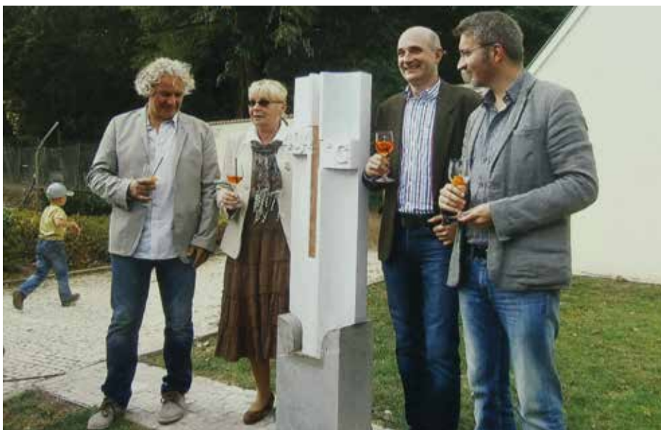
Odhalení pomníku nejvyšší teploty v Dobřichovicích, září 2015.

Změnu klimatu můžeme vnímat na našich zahradách. Podle vystudované bioložky to bylo znatelné zvláště loni, kdy teploty v říjnu a listopadu byly doslova jarní, proto ještě do začátku prosince