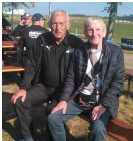
Na mistrovství světa v Uhlířských Janovicích.

Liběna Nová