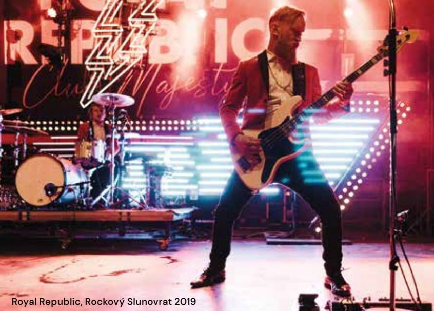
Royal Republic, Rockový Slunovrat 2019