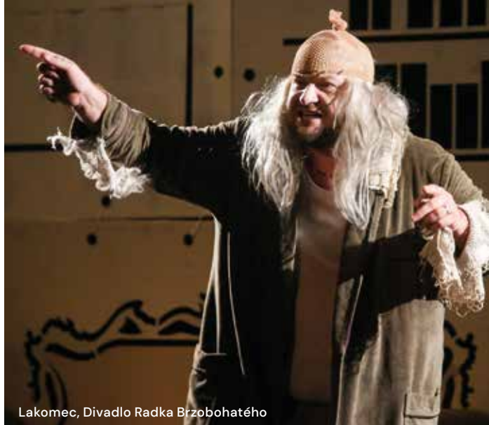
Lakomec, Divadlo Radka Brzobohatého