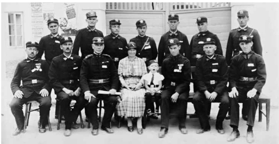
Zakládající členové SDH v Dobřichovicích.

S ohněm bojoval člověk od pradávna. Hasiči existovali už ve starověkém Římě. První hasičský sbor tam v 1. století našeho letopočtu sestavil politik a vojevůdce Marcus Licinius Crassus z otroků. Z boje s ohněm si ale spíš udělal výnosný byznys. Plameny totiž začala jednotka likvidovat až tehdy, když velitel vyjednal cenu za jejich uhašení. Po zániku Římské říše protipožární ochrana na dlouhou dobu upadala. Se vznikem nových měst a vesnic ve středověku nebezpečí požárů rostlo. Stavení byla ze dřeva, střechy doškové nebo šindelové. A tak není divu, že se to v kronikách požáry jen hemží. Obvykle museli hasit všichni občané. Neorganizovaný způsob likvidace požáru trval staletí. Změny přišly s vládou Marie Terezie a Josefa II. v 18. století. První sbor dobrovolných hasičů na území Rakouska-Uherska založili v roce 1850