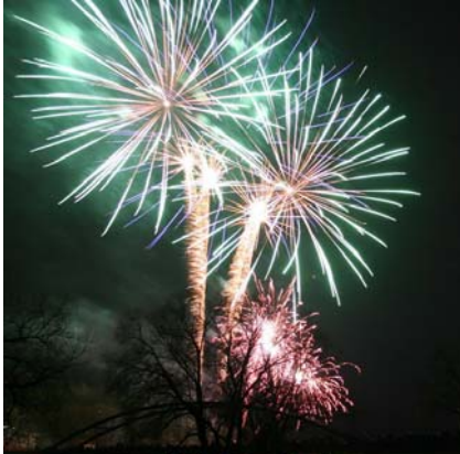
Tradičním ohňostrojem byl zahájen 1. prosince v Dobřichovicích adventní čas.