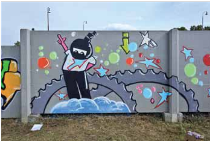
Graffiti v Řevnicích

V polovině června ZUŠ Řevnice organizovala a uskutečnila tvůrčí streetartovou dílnu pod vedením umělce a studenta VŠUP v Praze Š. Soukupa. Graffiti a street art již nejsou fenoménem, ale nedílnou součástí doby. Každý se s touto formou umění určitě setkal. To, jak se nám graffiti zamlouvá, jistě souvisí s uměleckou a výtvarnou úrovní tvůrce. U nás je tradice graffiti přece jenom o něco mladší než ve světě a z toho možná pramení fakt, že se neustále těší velké popularitě u dospívající mládeže. Nápad tvořit ve veřejném prostoru je reakcí na současný trend a velkou chuť žactva se zapojit. Zvládnout externí velké plochy je poměrně náročný úkol, proto jsme celou akci