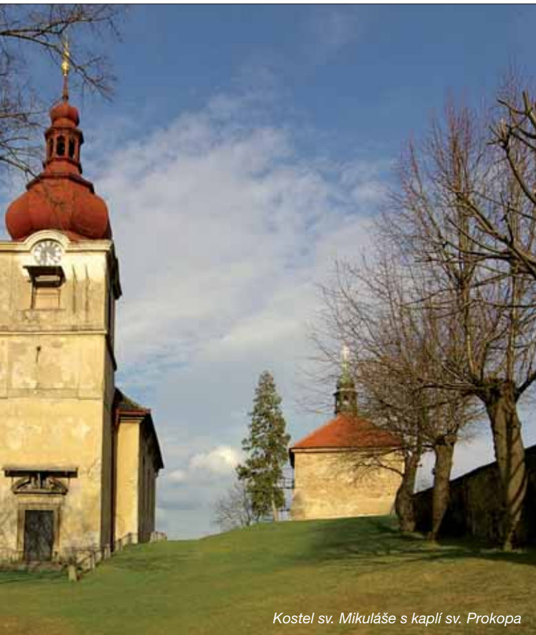
Kostel sv. Mikuláše s kaplí sv. Prokopa

vislého pásu obrazů, jakéhosi gotického „komiksu“ z doby kolem roku 1380. Tehdy, možná na přímý příkaz císaře Karla IV., byla na stěnách kaple, nebo spíše kostelíku, zachycena v sérii zhruba čtrnácti obrazů celá legenda o svatém Prokopovi. Unikátní soubor gotických fresek, ač místy poškozený (některé fresky také zanikly proražením dodatečných okének či pozdějším vsazováním náhrobních desek děkanů), se přesto zachoval v celistvosti, jež nemá v Čechách obdoby. Běží ve dvou pásích nad sebou po celém obvodu kaple: obraz za obrazem vypráví příběh o životě svatého Prokopa, založení Sázkavského kláštera a o zázracích, které se tam odehrály.