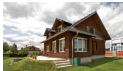
Návrh fasády – vizualizace