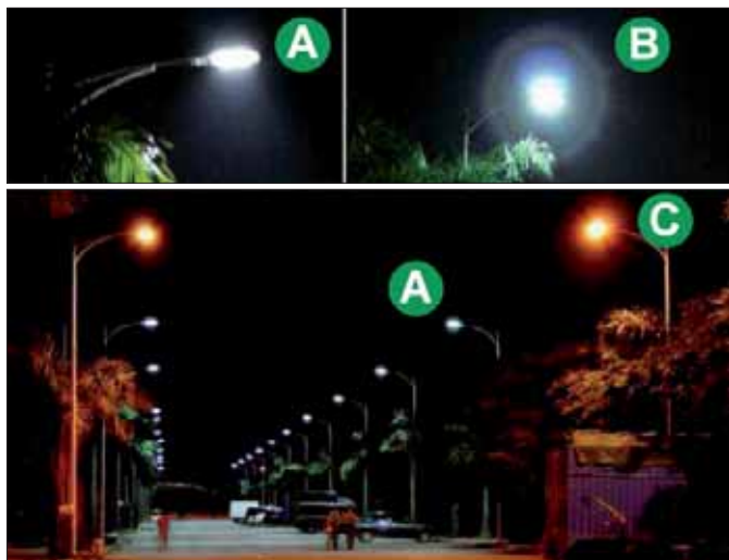
Osvětlení technologií LED

Hlavními výhodami LED technologií jsou úspornost a delší životnost žárovek, jsou tedy mnohem lepší než klasické, technicky zaostalé výbojky. Vesnice bude lépe a výrazně levněji osvětlena než dosud. „S novými LED svítidly dokážeme obci