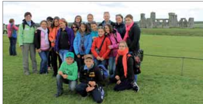
ZŠ Dobřichovice a Vinoř v Londýně