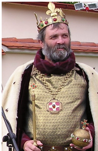
V sobotu 28.7. 2007 proběhly v Zadní Třebani Slavnosti trubačů. Více na straně 4.

Nyní navážeme a budeme pokračovat převážně o tom, které internetové vyhledávače lze využít.