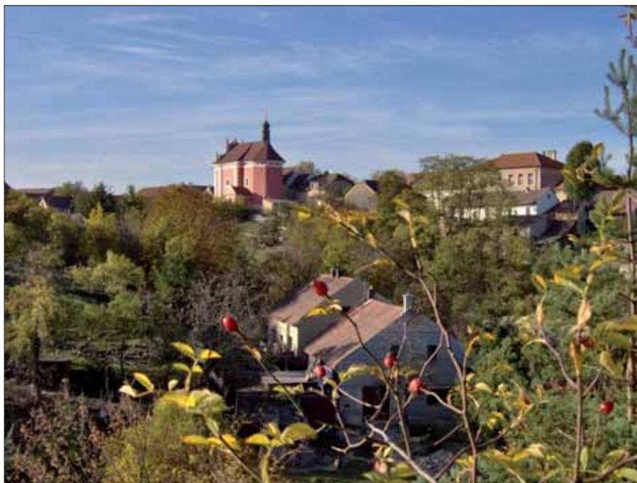
Kostel sv. Ludmily

Pravděpodobně již z 10. století je kostel sv. Kateřiny, který stojí v blízkosti rozvalin hradu. Ke kostelu patří také hřbitůvek a zvonice. O pár metrů vedle stojí kostel sv. Ludmily ze 17. století, který je postavený v barokním slohu. Jednoduchá stavba má plochou klenbu a jednoduchý kamenný oltář. Podle historických pramenů byla sv. Ludmila zavražděna na jednom z kamenů, které jsou po stranách oltáře. Po-