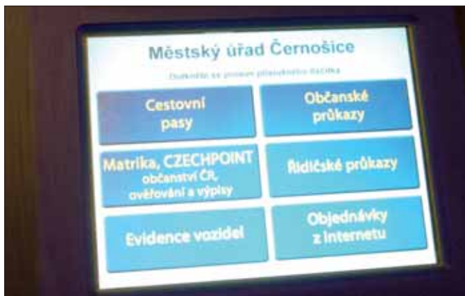
Vyvolávací systém na pracovišti v Podskalské

Pracoviště Městského úřadu Černošice v Praze v Podskalské nabízí občanům velmi zajímavou službu – objednání klienta ke konkrétní přepážce na určitou hodinu prostřednictvím sítě Internet. Na adrese www.mestocernosice.cz v hlavním menu se nachází položka Objednávání klientů – Vyvolávací systém – objednávka pořadového čísla. Objednat se lze na téměř všechny činnosti, včetně evidence vozidel nebo žádosti o pas. V úředních hodinách lze na každou hodinu objednat zatím maximálně dva klienty. Po rezervaci na výše uvedené stránce obdrží každý klient čtyřmístný PIN, prostřednictvím kterého si přímo na úřadě vyzvedne z vyvolávacího systému pořadové číslo. Poté již pouze vyčká na vyvolání svého čísla. (bt, mn)