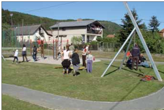
Dětské hřiště v Karlíku