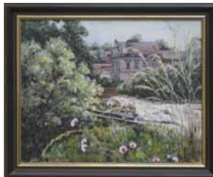
Jez v Chrástu nad Sázavou