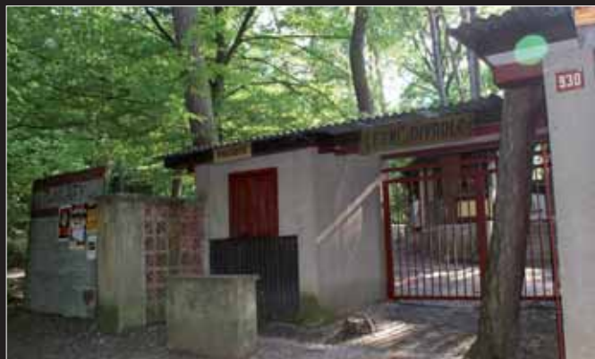
Domovem ochotníků je Lesní divadlo

Ustavující valná hromada Jednoty divadelních ochotníků se konala 4. 3. 1923. Nedlouho poté část členů založila další soubor, ale časem se spolky zase spojily. Na konci 30. let tu dokonce hostovali slavní herci L. Pešek, O. Korbelař nebo A. Nedošínská. Za 2. světové války vyhořel sál hotelu Grand, kde