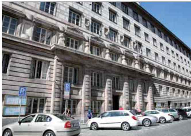
Městský úřad Černošice, pracoviště Podskalská

Ve čtvrtek 4. července byla vernisáž otevřena další výstava fotografií. Tentokrát jde o Stopy světla fotografky Ivy Mašinové. Expozici si budete moci prohlédnout denně od 10:00 do 22:00 hod. až do 9. srpna. (iDobnet.cz)