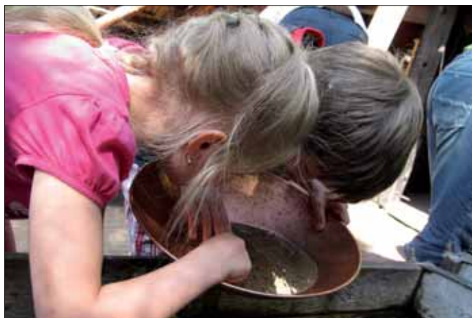
Ukázka rýžování zlata – šikovné a trpělivé děti jsou odměniny náletem lesklého kovu v písku

Centrum řemesel a umění s ukázkami tradičního umění dráteníka, hrnčíře, provazníka, mydláře, svíčkaře či papírníka nabízí prožitek na vlastní