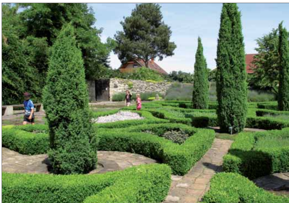
Zahrady Botanicusu nabízejí různé formy bludišť

Restaurace Hájenka se nachází v Kersku, v obci Hradištko v nymburském okrese. Jedná se o lesní městečko