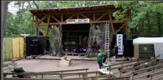
Divadlo patří městu, které ho pronajímá i na jiné akce. Nedávno se tu konal folkový festival Porta

Paenza nastala ještě po roce 1990, na konci 90. let bylo ale divadlo znovu opraveno a začala nová éra. Dnes se