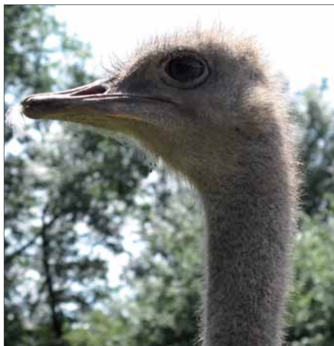
V zahradách najdete také domácí zvířata – králíky, drůbež a mezi nimi i pštrosa