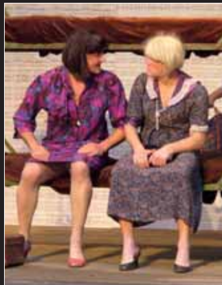
Velmi vydařená byla hra Rád to někdo horké z roku 2009

A je tomu tak i dnes. Divadelní soubor Řevnice, jak zní oficiální název, uvádí každý rok tři až čtyři nové hry, většinou se hraje v Lesním