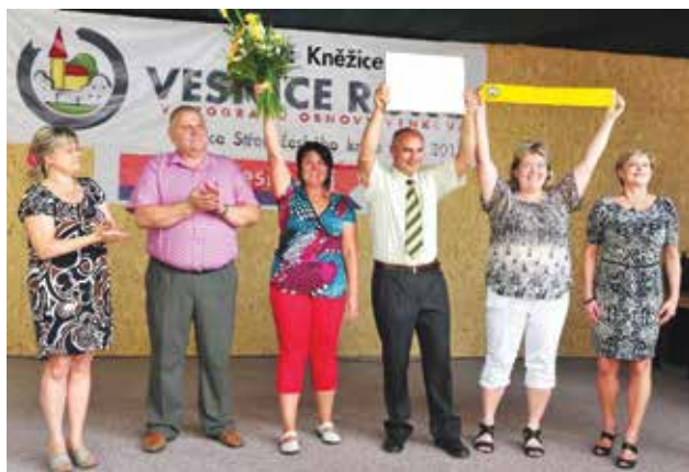
Z loňského vyhlášení.