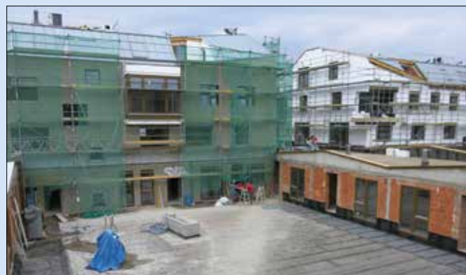
Dobříchovické byty pro seniory budou dokončeny letos na podzim.

není podmíněno věkem, ale je ideální právě pro seniory, kteří zde najdou pomocnou ruku i společenské vyžití. Budou zde poskytovány služby, jako je například úklid, donáška či příprava obědů, doprovod na úřady nebo k lékaři, praní a žehlení prádla a mnohé další. A přímo v objektu se buduje společenská místnost, kde se senioři budou moci potkat „na kus řeči“ a zúčastnit se rozličných aktivačních programů.