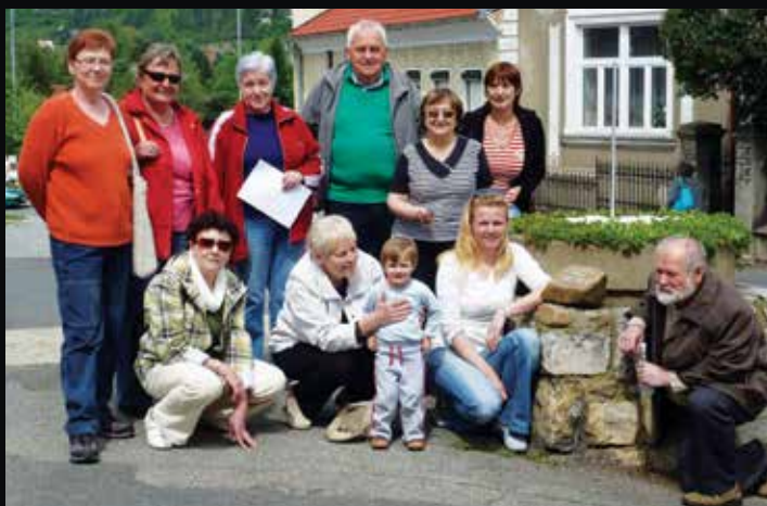
Praktická část semestru astronomie.