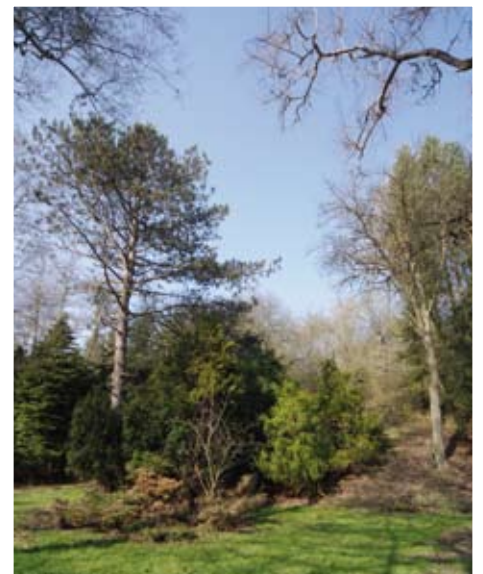
Zahrada sloužila více než dvě desetiletí jako výzkumné pracoviště Botanického ústavu ČSAV