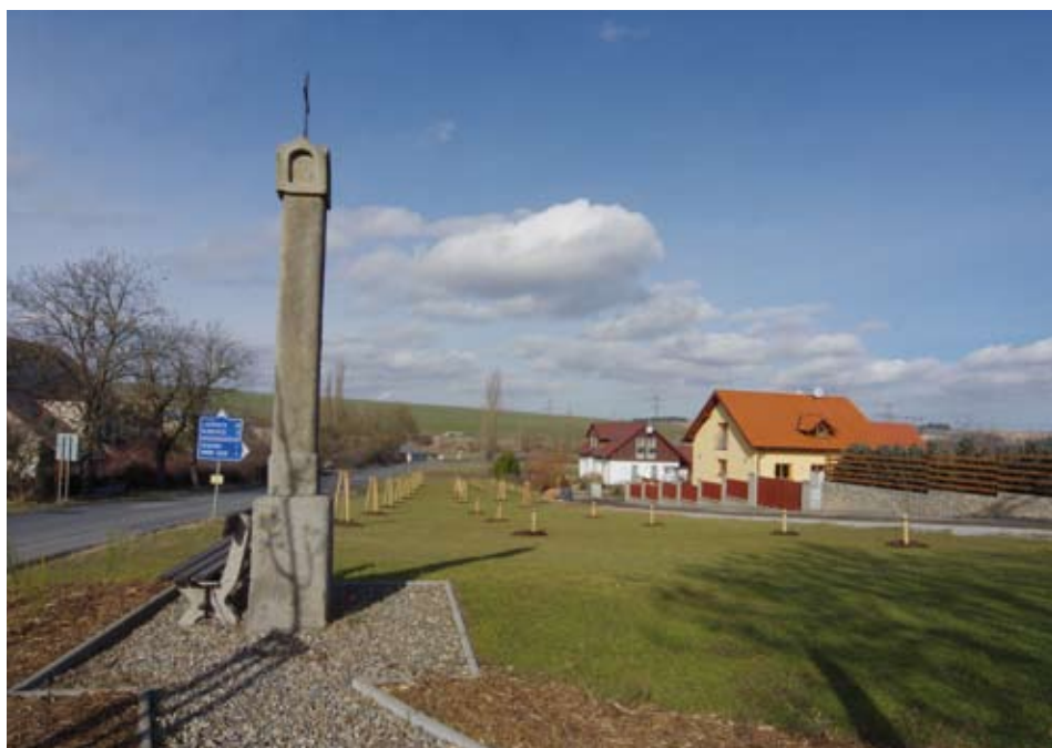
Nově upravené okolí u kamenných božích muk na konci obce Mořina

„Pro mne je strom především důležitým historickým, ale i estetickým fenoménem,“ navázal Václav Větvíčka. „Z hlediska praktického je, mimo jiné významné funkce, tím neefektivnějším klimatizačním zařízením. To se prokázalo při zkoumání rozložení tepla pod stromem a pod slunečником. Na rozdíl od slunečníků stromy výparem z listů v horkých dnech vzduch zvlhčují a zároveň ochlazují, takže poskytují nejen stín, ale také úžasné mikroklíma. Zejména ty staré, například osmdesátileté, dokážou takto nahradit několik desítek stromů ve stáří dvaceti let,“ upozornil závěrem.