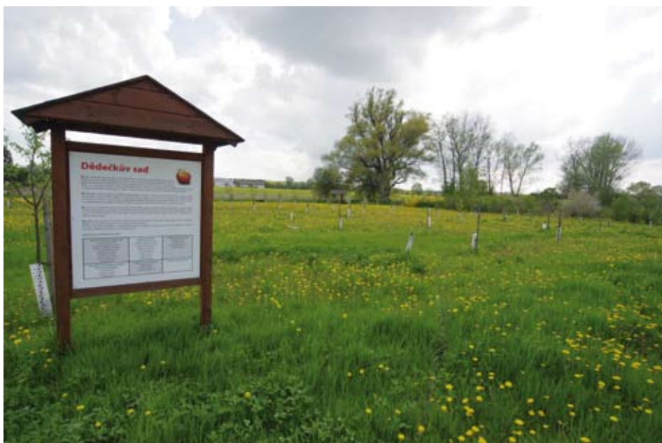
Dědečkův sad – největší zastoupení mezi 155 ovocnými stromky zde mají jabloně, třešně a ořešáky