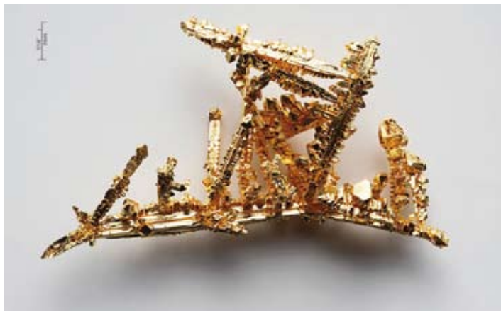
☒ Ilustrační foto: idobnet.cz

V podzemí České republiky je podle odhadů zlato za přibližně 400 miliard korun. (jm)