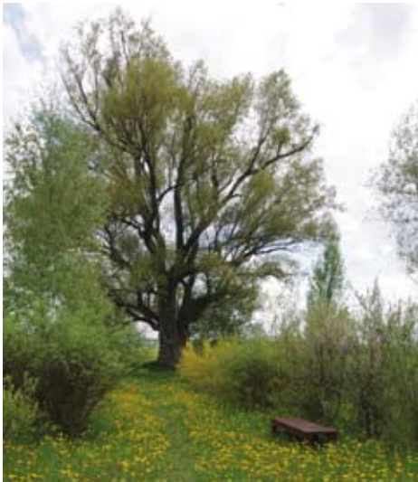
Vedle sadu najdeme i arboretum keřů českého venkova

Vraťme se ale k dolní Berounce. Dobřichovice se během několika let pustily do revitalizace zeleně v ulicích a na veřejných prostranstvích, zejména ve vazbě na významnou a oblíbenou cyklostezku kolem Berounky. Cestou k Mořině mjííme nový vodojem, společnou realizaci obcí Mořinka, Mořina a Lety, který je dokola rovněž osázen mladými stromky. Mohli bychom takto projít další města a obce v okolí, všude se v posledních letech projevuje snaha o výměnu starých a nemocných stromů a výsadbu nových.