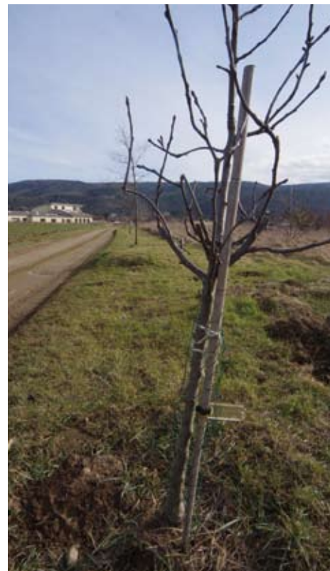
Cestou k Větrnému údolí vyrostla mladá jabloňová alej nových občánků obce Lety

„Už toto staré přísloví radí dobrému hospodáři velmi prozíravě,“ připomněl známý botanik Václav Větvíčka, „bývá to snazší, než bychom mysleli, až na ten strom!“