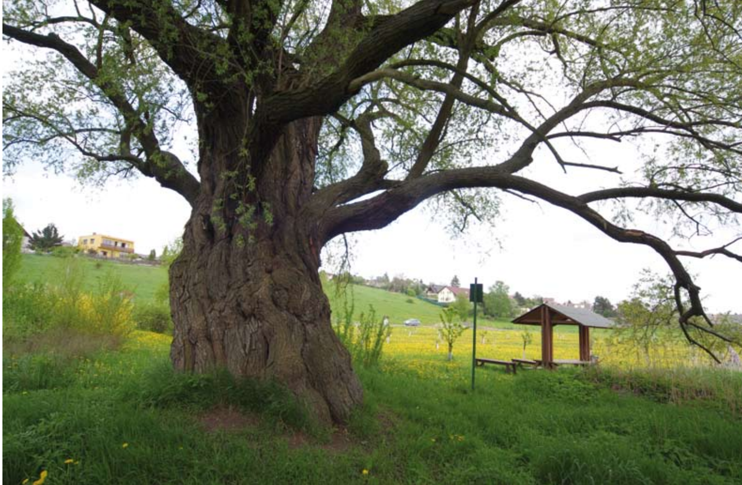
Jedna z nejstarších vrb bělokorych u nás uzavírá na levém břehu Radotínského potoka areál tachlovického Dědečkova sadu